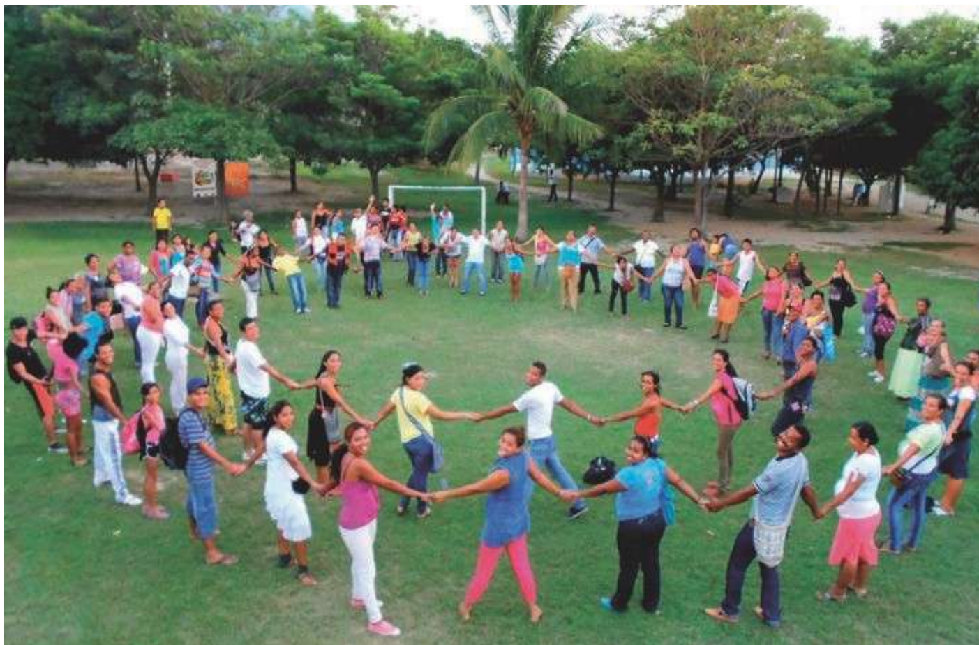
په سنتا ماريا کې د لېسې د سولې پروگرام د فارغانو سره د اين ار سي د غونډې انځور. اندريه نيپيتو/۲۰۱۲/ د ناروې د کډوالو اداره