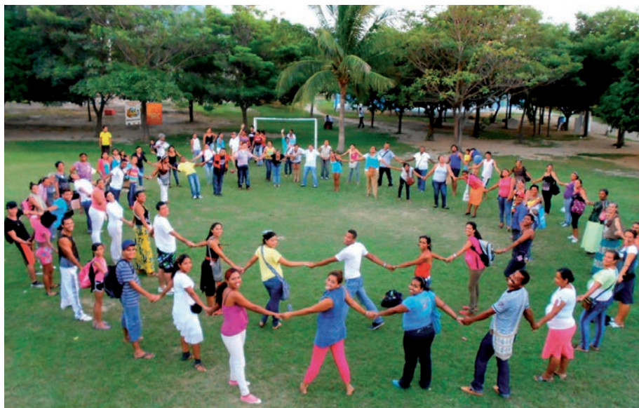
Encuentro entre estudiantes graduados del Programa de Escuelas Secundarias para la Paz del Consejo Noruego de Refugiados en Santa Marta, Colombia.