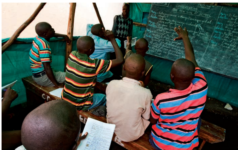
Ex niños soldado presentes en una clase de inglés de un centro de tránsito y orientación a cargo de la ONG nacional CAJED (Concert d'Action pour Jeunes et Enfants Défavorisés) al este de la ciudad de Goma, capital de la Provincia de Kivu Norte, República Democrática del Congo.

¿Los programas que incluyen actividades para mejorar los servicios básicos e instalaciones educativas toman en cuenta el contexto de conflicto actual e histórico?